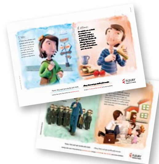
Anúncios veiculados em revistas

A repercussão junto aos clientes tem sido muito positiva. O site do Fleury tem recebido depoimentos espontâneos de clientes que experimentaram, na prática, os diferenciais de atendimento da companhia. Esses relatos podem ser acessados no endereço www.fleury.com.br .