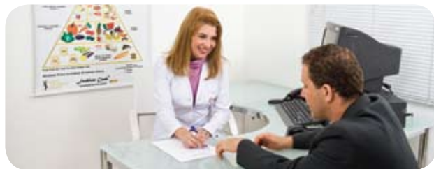
Consulta nutricional é mais uma novidade do Check-up Fleury ao lado da consulta dermatológica