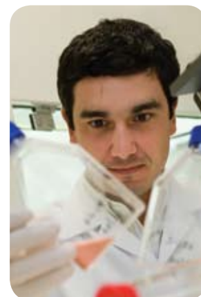
P&D: 37 novos produtos no primeiro semestre

No primeiro semestre, 37 novos produtos e alterações de metodologias e 13 novos modelos de relatórios integrados passaram a ser oferecidos aos nossos clientes. Esses desenvolvimentos foram acelerados com o ingresso de 1,3 milhão de reais captados junto à Finep no período, no contexto do 'Programa Inova Brasil' do Ministério da Ciência e Tecnologia.